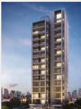
Indi Vila Olímpia

Constrói os empreendimentos do grupo e de terceiros. Atua nos segmentos residencial, comercial, hospitalar e shoppings. Hoje, ela é uma das construtoras mais atuantes do mercado.