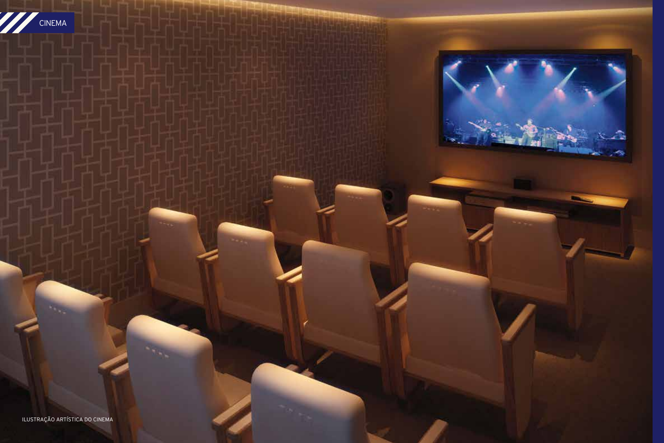
ILUSTRAÇÃO ARTÍSTICA DO CINEMA