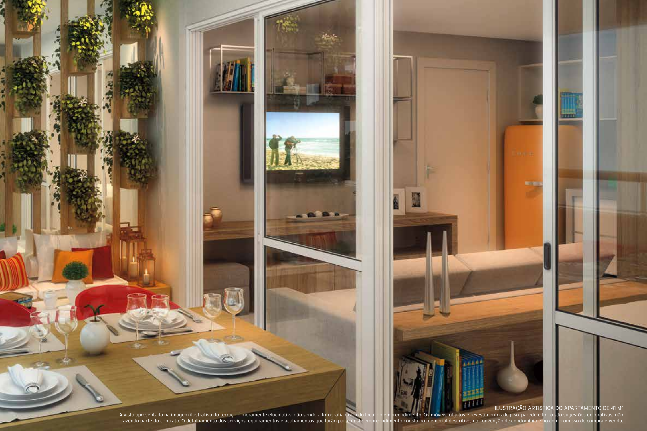
ILUSTRAÇÃO ARTÍSTICA DO APARTAMENTO DE 41 M 2 A vista apresentada na imagem ilustrativa do terraço é meramente elucidativa não sendo a fotografia exata do local do empreendimento. Os móveis, objetos e revestimentos de piso, parede e forro são sugestões decorativas, não fazendo parte do contrato. O detalhamento dos serviços, equipamentos e acabamentos que farão parte deste empreendimento consta no memorial descritivo, na convenção de condomínio e no compromisso de compra e venda.