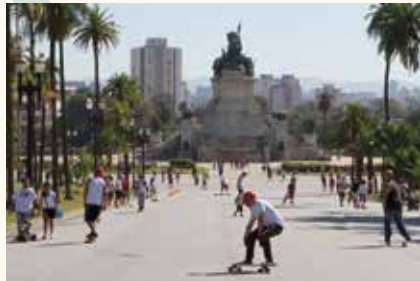
Parque da Independência