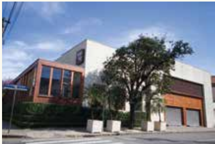
Pizzaria Sala Vip