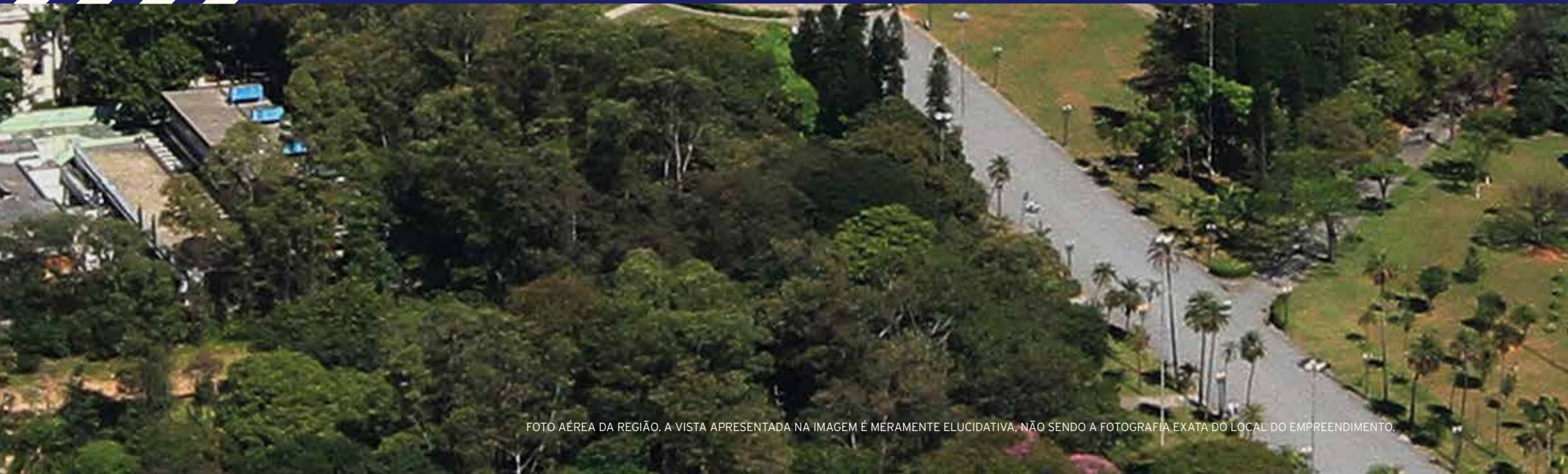
FOTO AÉREA DA REGIÃO. A VISTA APRESENTADA NA IMAGEM É MÉRAMENTE ELUCIDATIVA, NÃO SENDO A FOTOGRAFIA EXATA DO LOCAL DO EMPREENDIMENTO.