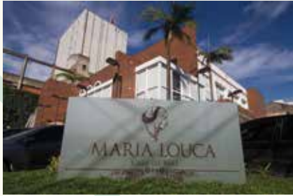
Panificadora Maria Louca