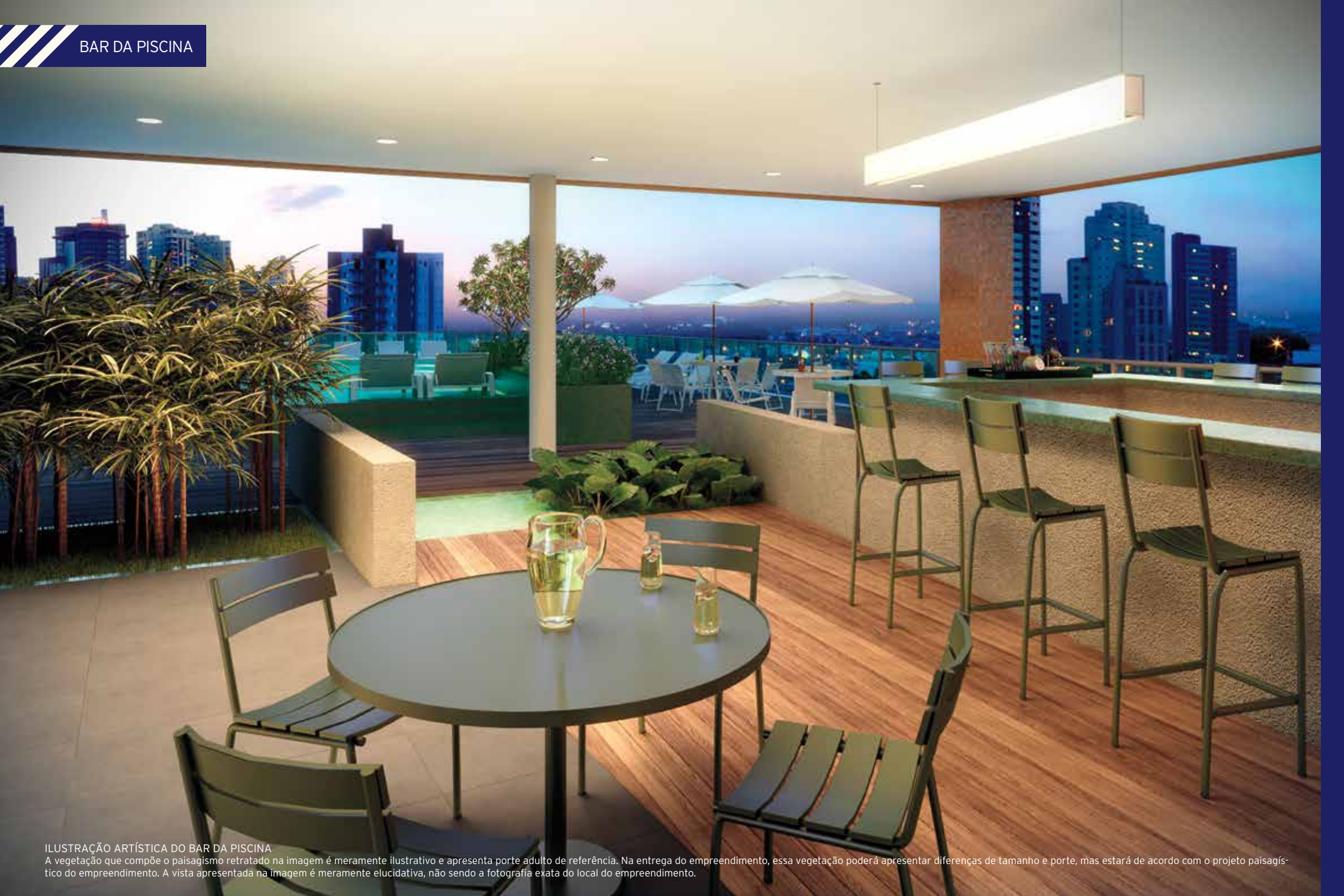
ILUSTRAÇÃO ARTÍSTICA DO BAR DA PISCINA

A vegetação que compõe o paisagismo retratado na imagem é meramente ilustrativo e apresenta porte adulto de referência. Na entrega do empreendimento, essa vegetação poderá apresentar diferenças de tamanho e porte, mas estará de acordo com o projeto paisagístico do empreendimento. A vista apresentada na imagem é meramente elucidativa, não sendo a fotografia exata do local do empreendimento.