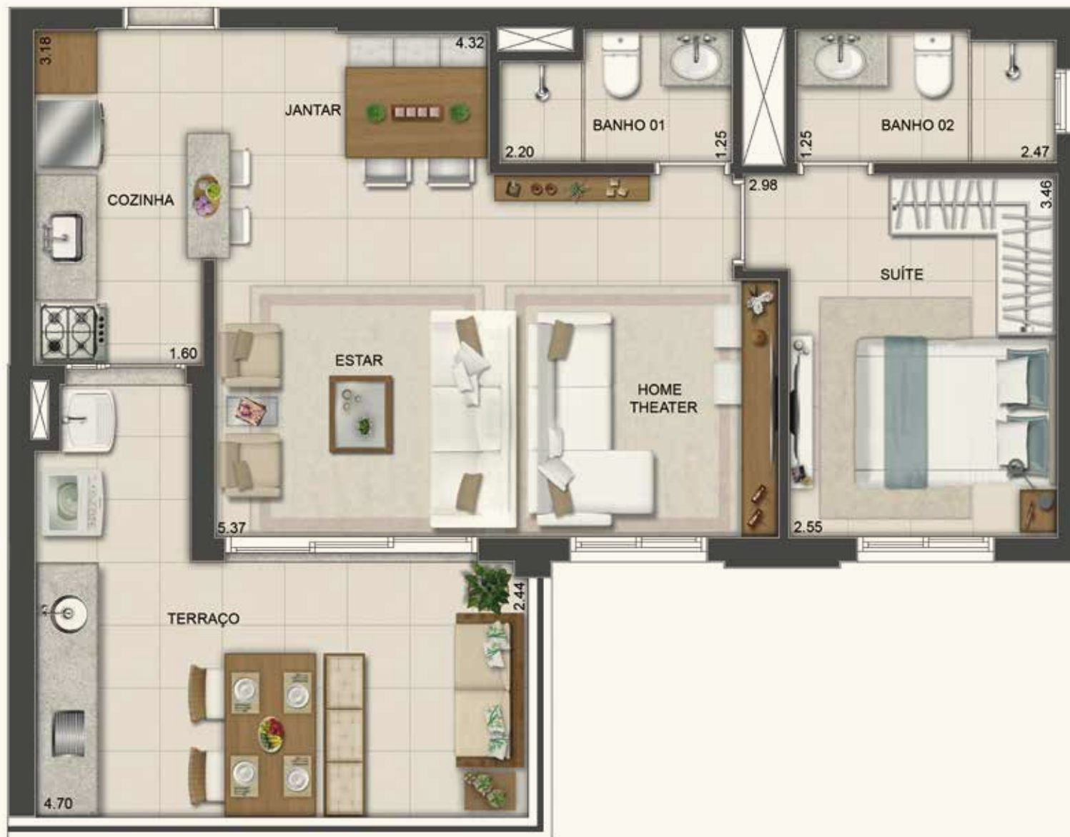
Ilustração da planta opção sala ampliada de 65 m 2

Os móveis, objetos e revestimentos de piso, parede e forro são sugestões decorativas, não fazendo parte do contrato. O detalhamento dos serviços, equipamentos e acabamentos que farão parte deste empreendimento consta no memorial descritivo, na convenção de condomínio e no compromisso de compra e venda. Medidas livres entre paredes estão sujeitas a variações em decorrência da execução e dos acabamentos a serem utilizados.