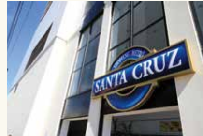
Shopping Santa Cruz