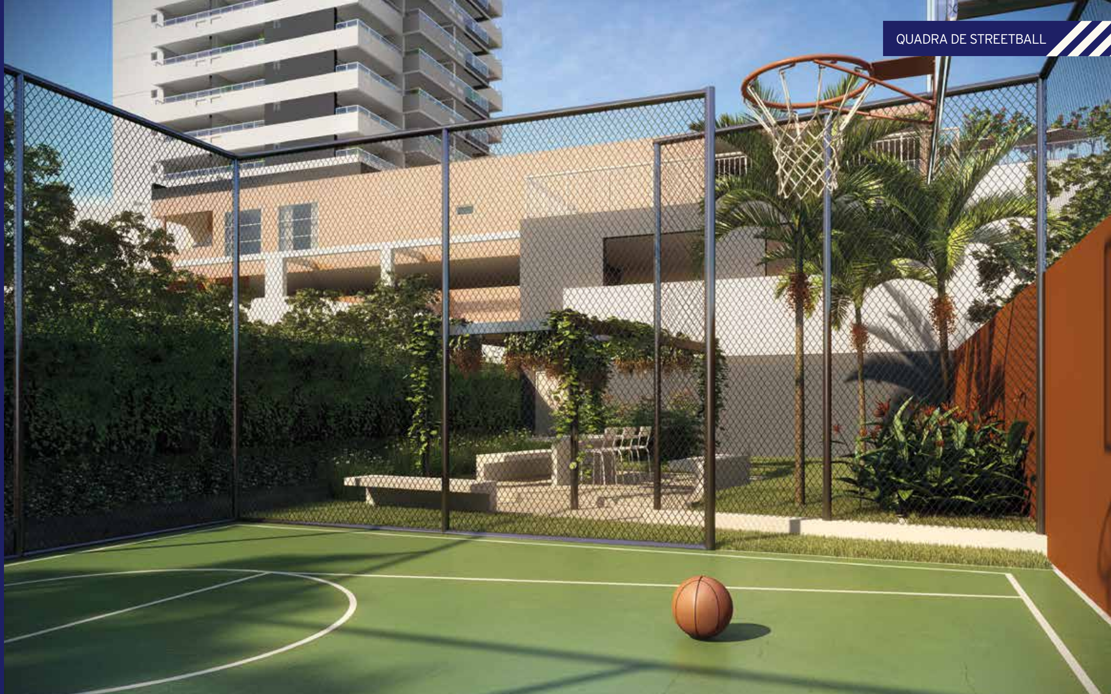
ILUSTRAÇÃO ARTÍSTICA DA QUADRA DE STREETBALL

A vegetação que compõe o paisagismo retratado na imagem é meramente ilustrativo e apresenta porte adulto de referência. Na entrega do empreendimento, essa vegetação poderá apresentar diferenças de tamanho e porte, mas estará de acordo com o projeto paisagístico do empreendimento.