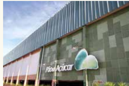
Pão de Açúcar