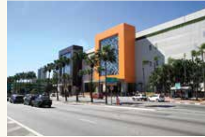
Shopping Plaza Sul