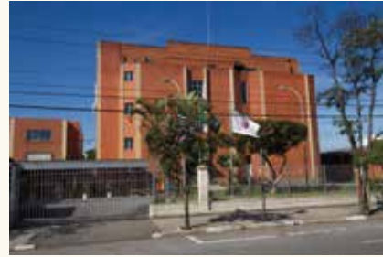
Faculdade São Camilo