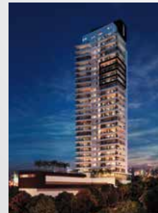
DSGN Campo Belo