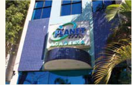
Academia Planet Sport