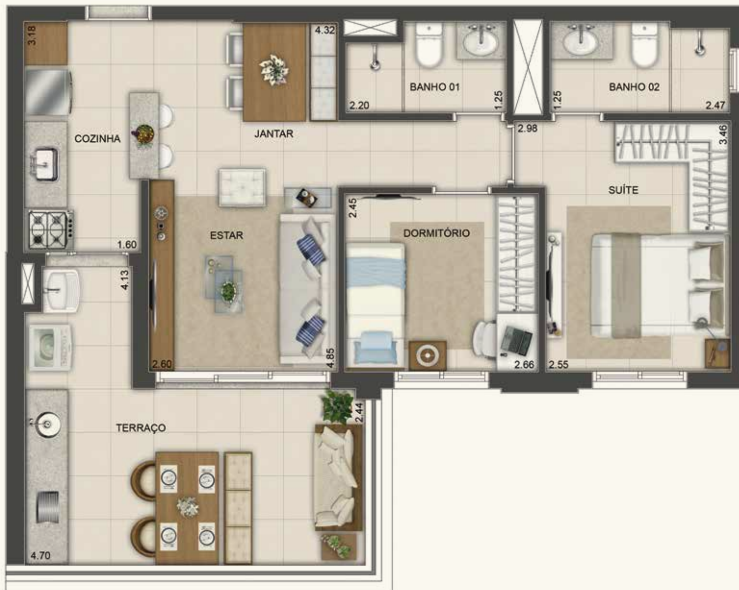
Ilustração artística da planta tipo de 65 m 2

Os móveis, objetos e revestimentos de piso, parede e forro são sugestões decorativas, não fazendo parte do contrato. O detalhamento dos serviços, equipamentos e acabamentos que farão parte deste empreendimento consta no memorial descritivo, na convenção de condomínio e no compromisso de compra e venda. Medidas livres entre paredes estão sujeitas a variações em decorrência da execução e dos acabamentos a serem utilizados.