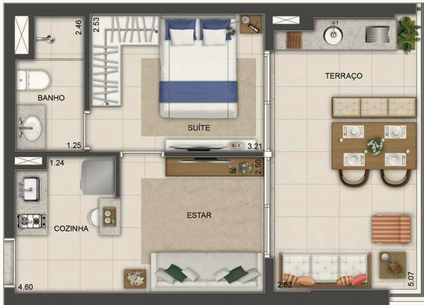
Ilustração artística da planta tipo de 41 m 2