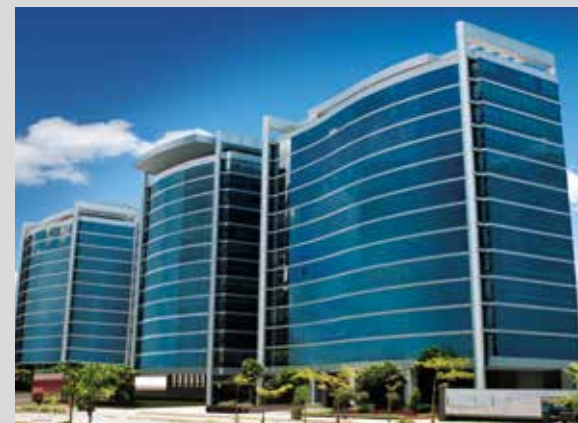
Alpha Tower | Capital Center | One Hundred