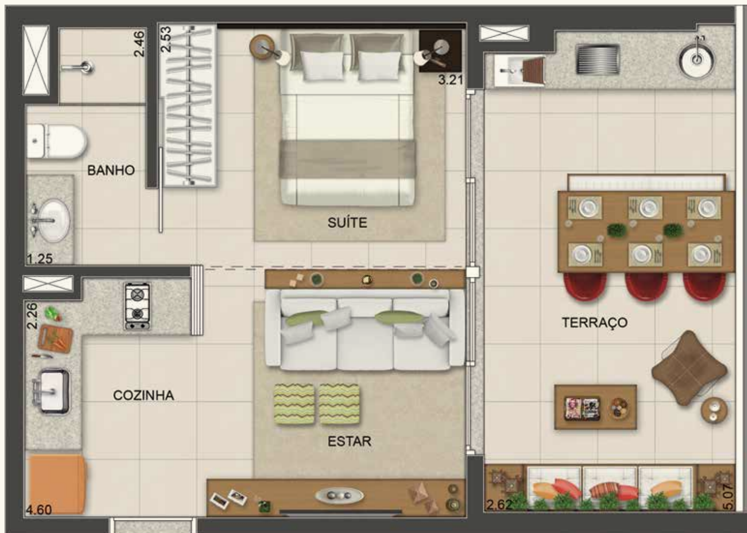
Ilustração da planta opção espaços integrados de 41 m 2